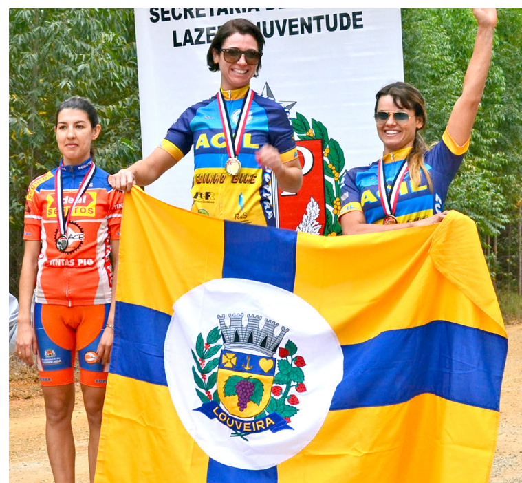
No ciclismo Louveira foi ouro e prata em 2014

Os Jogos Regionais, junto aos Jogos Abertos do Interior, são considerados os maiores torneios realizados no país e contam com a participação de diversos atletas olímpicos. Louveira disputa os Regionais desde 1999 e sempre ficou entre as 15 principais cidades da divisão de acesso.