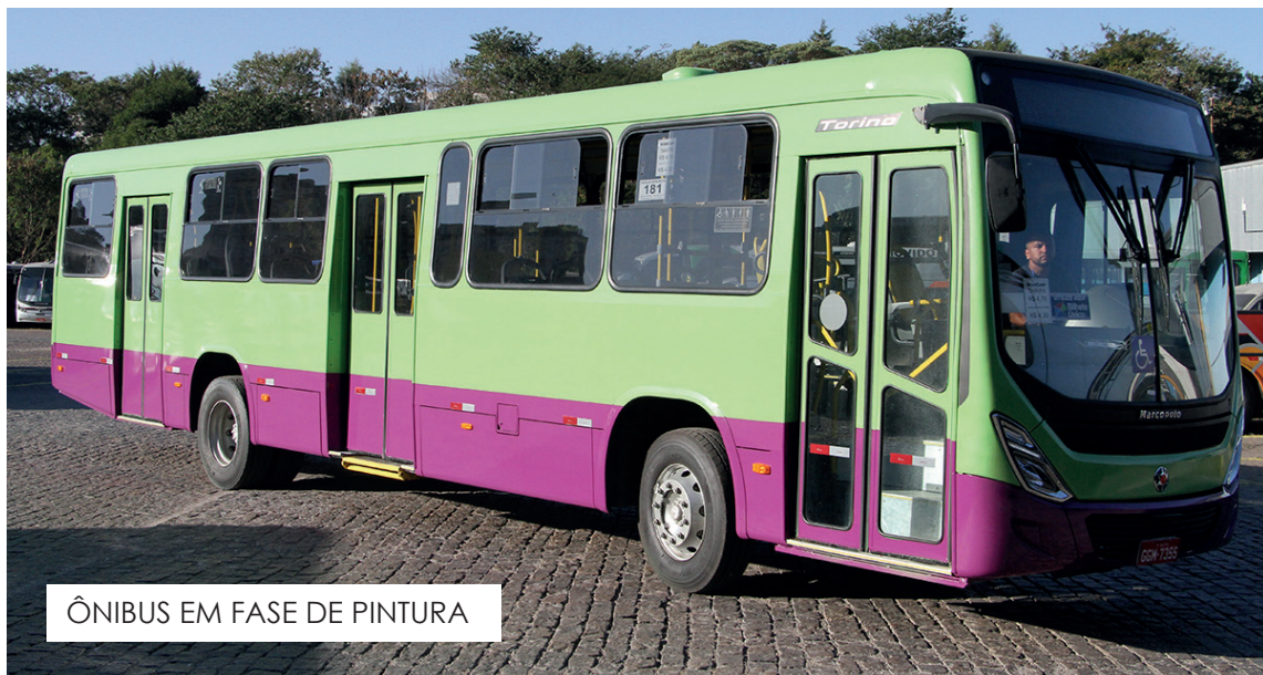
ÔNIBUS EM FASE DE PINTURA

Criação de linhas especiais para eventos na cidade e estudos de alterações ou ampliação de linhas