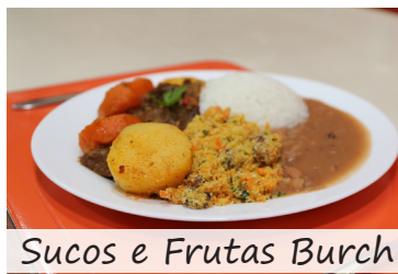
Sucos e Frutas Burch