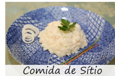
Comida de Sítio