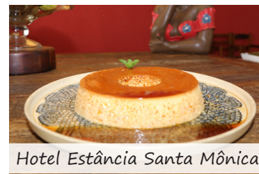
Hotel Estância Santa Mônica