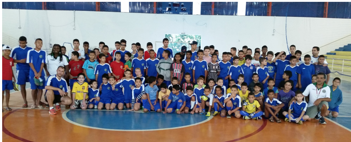
Crianças e adolescentes participam do Festival de Futsal 1º de Maio

putas aconteceram às 8h no Estádio Municipal, Campo do Nova Estrela e no Clube Bandeirantes. Participaram cerca de 850 pessoas entre atletas e dirigentes. Confira o resultado dos jogos no site: www.louveira.sp.gov.br .