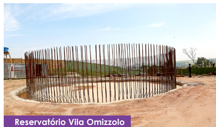
Reservatório Vila Omizzolo

5- Um no Parque Brasil, na rua Antônio Bonesso, com capacidade para armazenar 1500 m 3 de água.