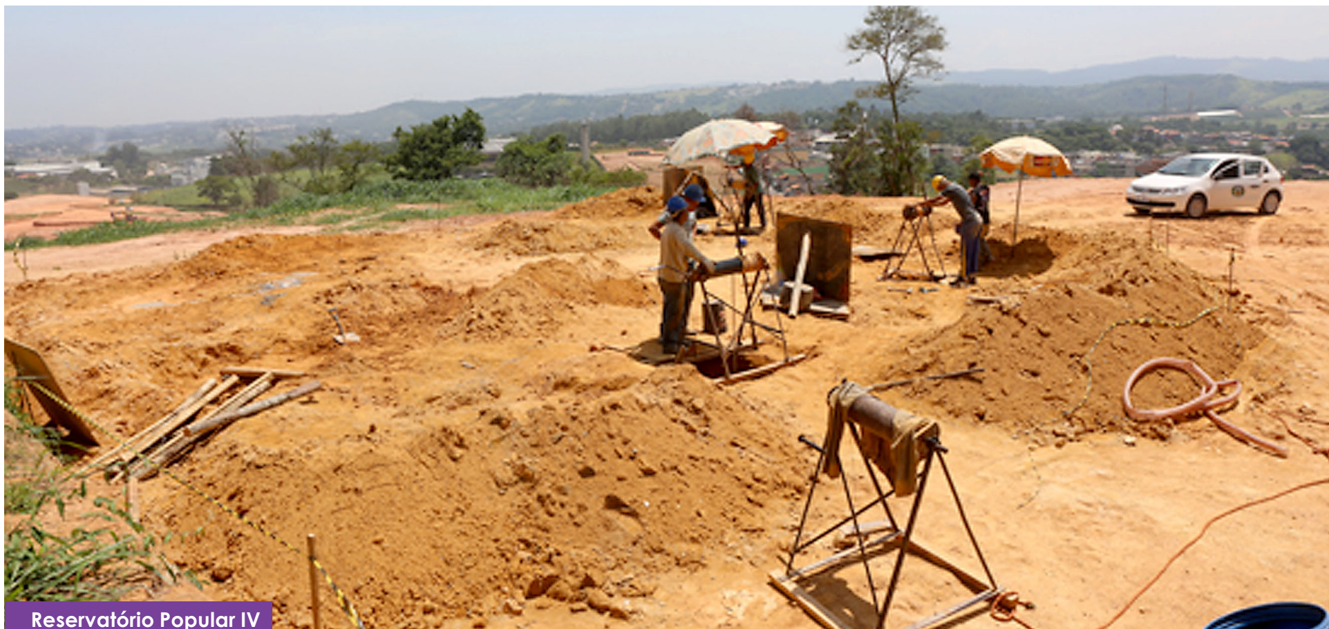
Reservatório Popular IV

Caixa d'água do Parque Brasil é a quinta em obras dentro de um planejamento que inclui 9 novos reservatórios