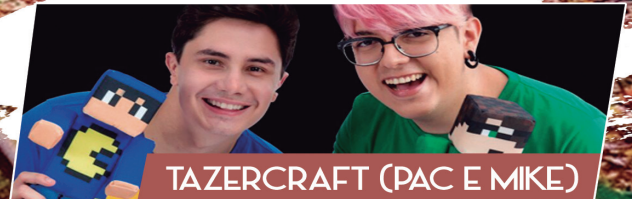
TAZERCRAFT (PAC E MIKE)