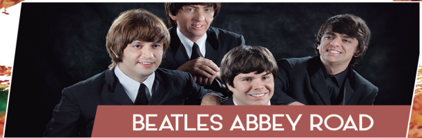
BEATLES ABBEY ROAD