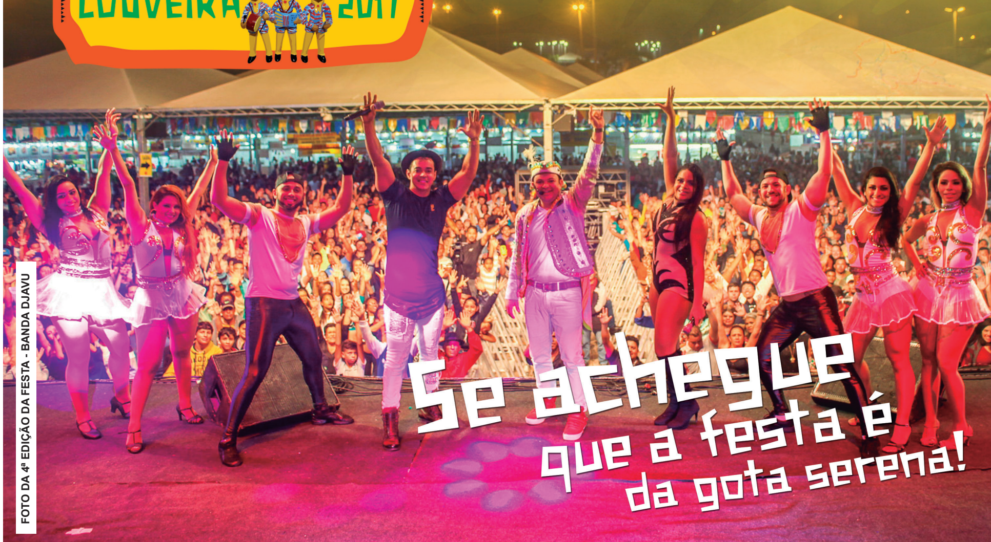
FOTO DA 4ª EDIÇÃO DA FESTA - BANDA DJAVU

Se acheque que a festa é da gota serena!