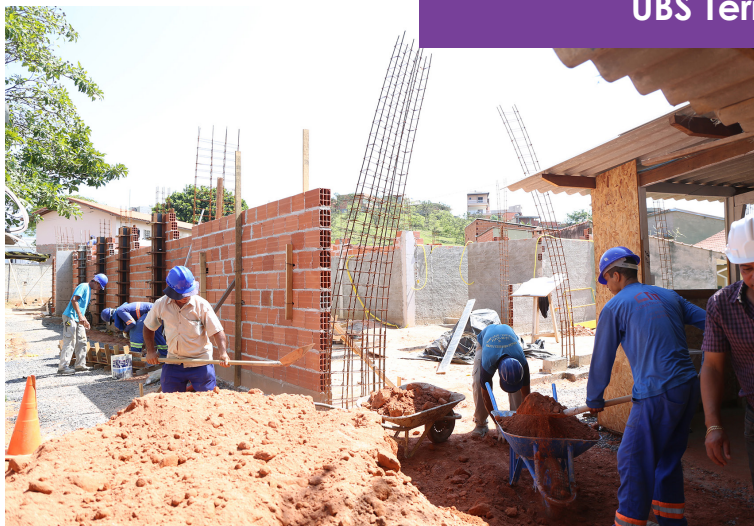
UBS Terra da Uva

A obra do posto de saúde do Sagrado Coração de Jesus, por sua vez, está em fase de fundação. A UBS foi projetada com estrutura semelhante à unidade de saúde do Terra da Uva.