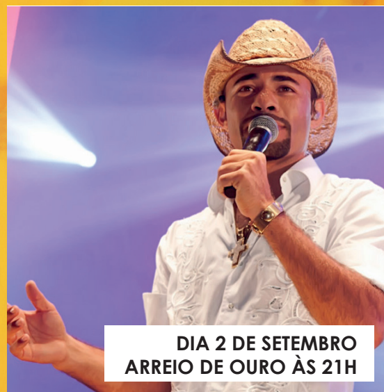
DIA 2 DE SETEMBRO ARREIO DE OURO ÀS 21H