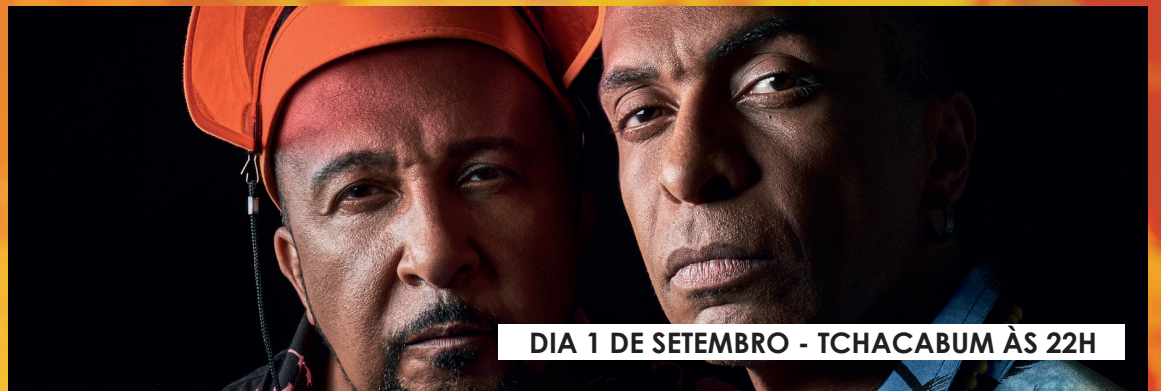
DIA 1 DE SETEMBRO - TCHACABUM ÀS 22H

Confira a programação completa nas imagens.