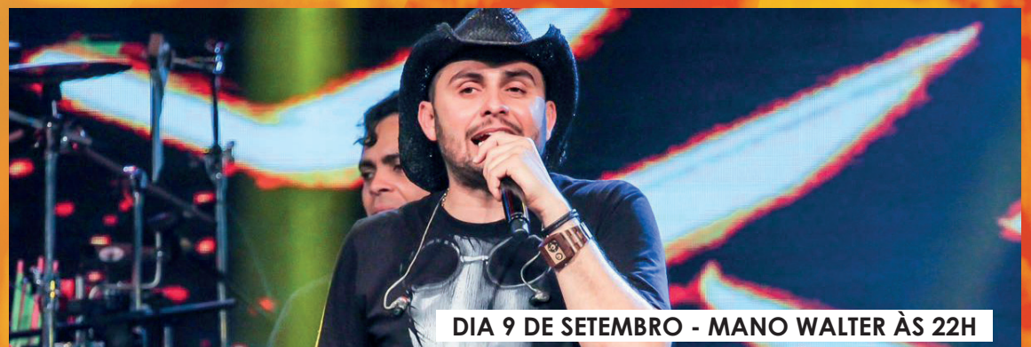
DIA 9 DE SETEMBRO - MANO WALTER ÀS 22H