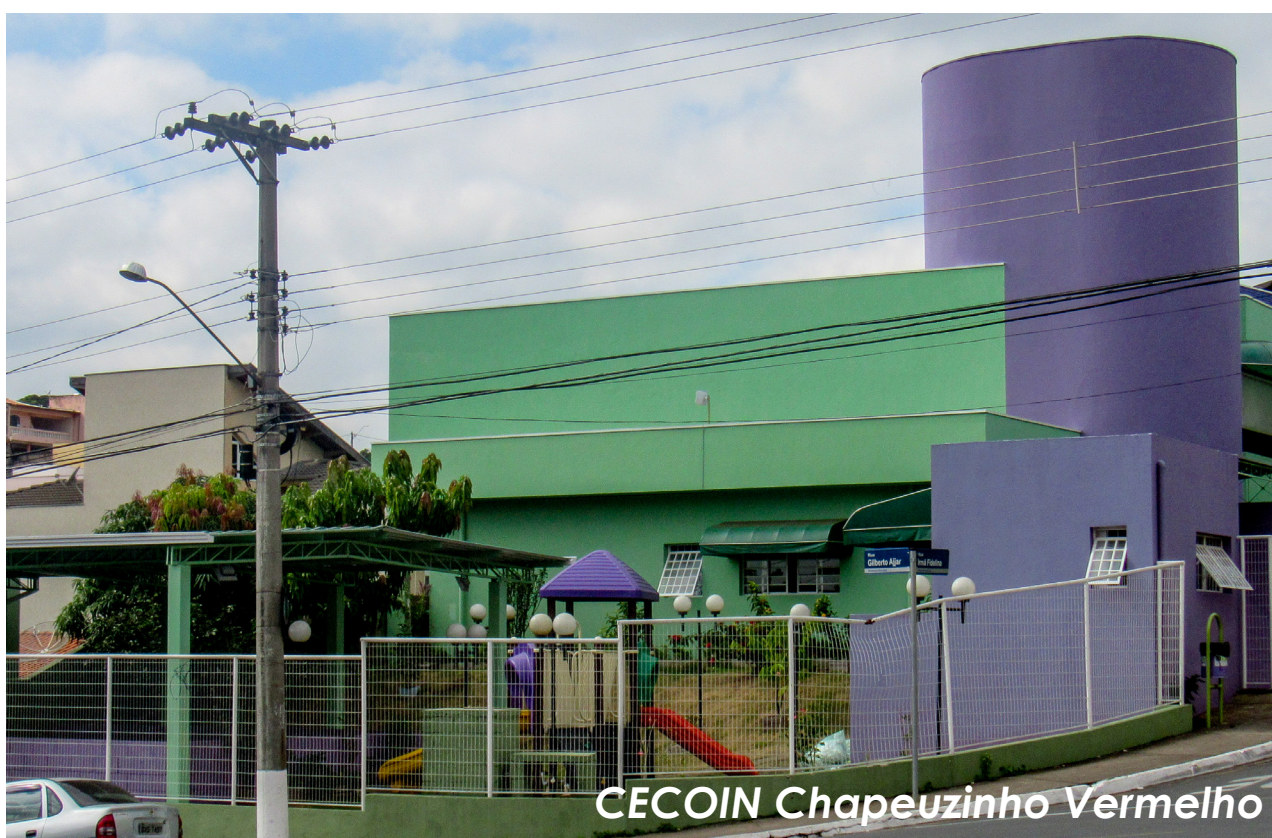
CECOIN Chapeuzinho Vermelho