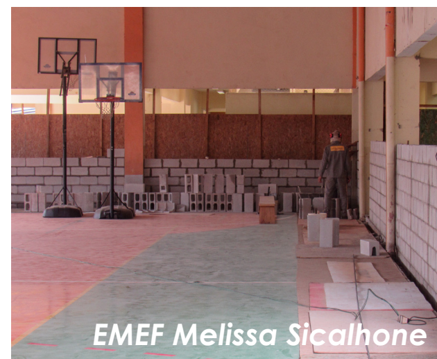
EMEF Melissa Sicalhione