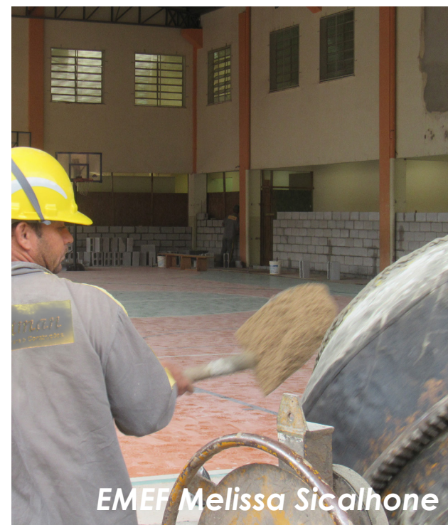
EMEF Melissa Sicalhione