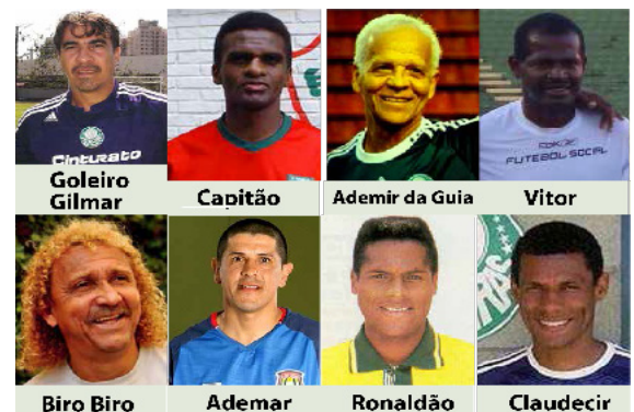
Jogo das Estrelas 14h