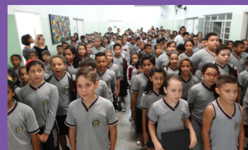
EMEF Odilon Leite Ferraz Municipal