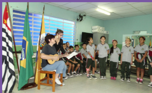
EMEF José Pereira Dutra - Bairro Estiva

Os trabalhos estão sendo entregues até essa sexta, dia 20 de março. Ainda serão divulgadas as datas do encerramento do Concurso Cultural Louveira 50 anos e da premiação.