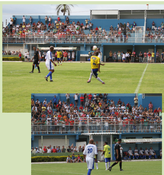
No ano passado, o jogo comemorativo também arrecadou alimentos para ajudar ao Fundo Social de Solidariedade

Os interessados deverão levar 1 Kg de alimento não perecível (menos sal) na secretaria de esporte, localizada na Área de Lazer do Trabalhador ou no Ginásio do Jardim Esmeralda até esta sexta-feira, 20, e retirar os ingressos, que são limitados. O alimento arrecadado será destinado ao Fundo Social de Solidariedade, assim o futebol solidário, além de trazer alegria pra quem assiste, leva alegria para quem mais precisa de ajuda.