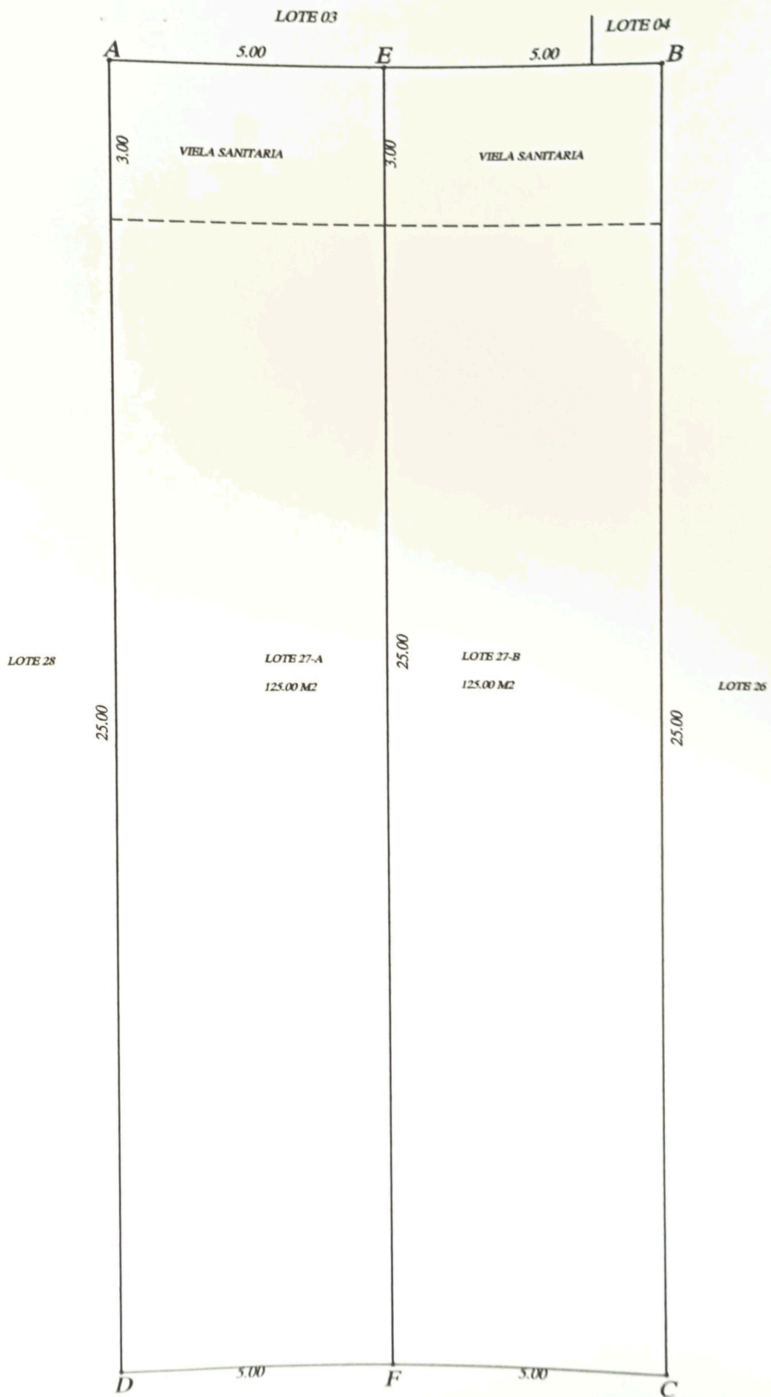
RUA ARMANDO TASSO ( antiga rua 06 ) SITUAÇÃO PRETENDIDA