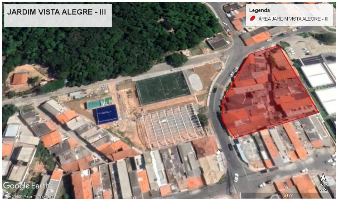
Latitude: 23° 5'12.61"S; Longitude: 46°59'2.44"O.