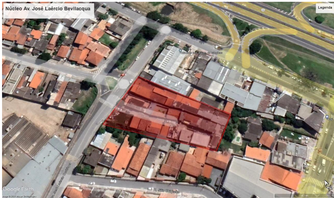
Latitude: 23° 5'1.69"S; Longitude: 46°58'43.12"O.