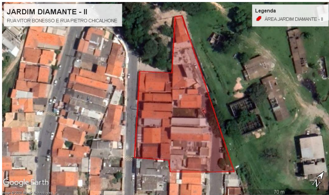
Latitude: 23° 4'58.36"S; Longitude: 46°58'56.16"O.